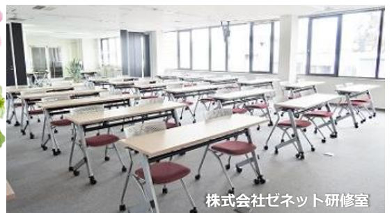
株式会社ゼネット研修室